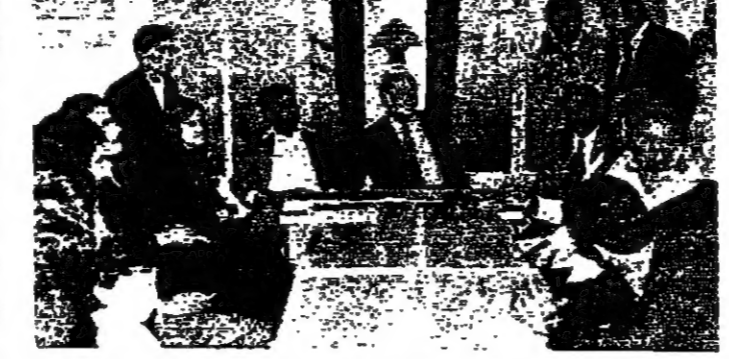
لجنة الدكوانة اثناء اجتماعها في مركز البلدية